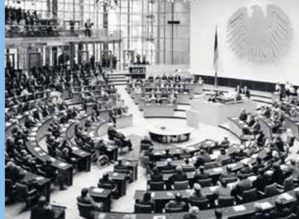
▲ Erste Bundestagssitzung im neuen Plenarsaal 1992