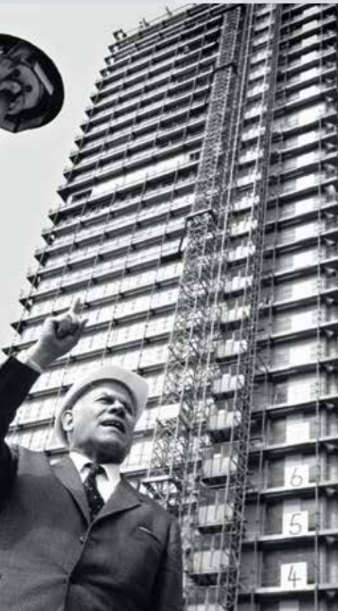
▲ Bundestagspräsident Eugen Gerstenmaier beim Richtfest des „Langen Eugen“ 1968